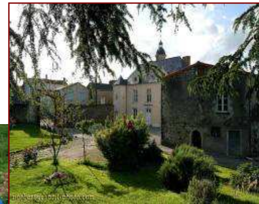
La Bretèche (Angers)