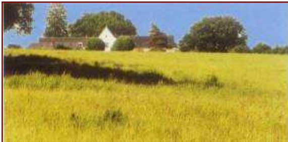
Les Besses (Châteauroux)

Dans un environnement proche de la nature, entourée d'animaux, chacune de nos maisons accueille une dizaine de jeunes. Depuis notre création, nous avons pu aider près de 300 jeunes.